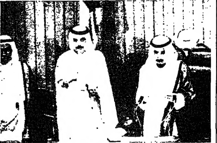
امير الكويت يفتتح المجلس الوطني

دعا امير الكويت الشيخ جابر الاحمد الصباح اسس المجلس الوطني الى التعاون مع الحكومة الجديدة التي تشكلت في حزيران الماضي، من اجل أمن واستقرار وتقدم الكويت.